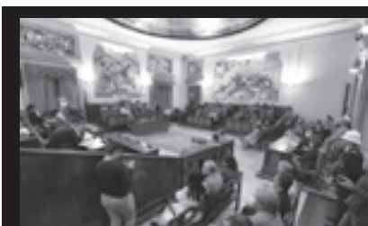
Comandiamo noi! E non si discute! 2

Il GAPA e i Cordai, che a San Cristoforo ci operano quotidianamente da anni, sono a fianco del Midulla, in tutti i sensi!