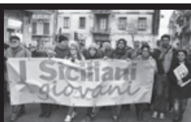
Mille passi con Fava 3