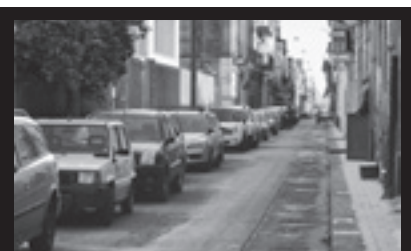
Immagini da oltre il confine 4