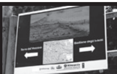
Bastione degli Infetti