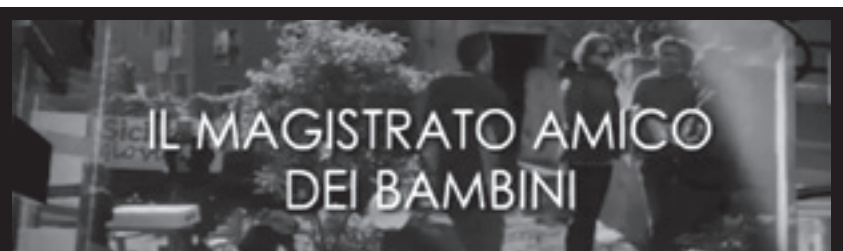
Un giardino per Titta Scidà